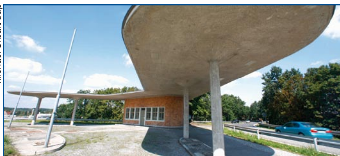
Unglaubliche Geschichte: Die älteste existierende Tankstelle Deutschlands ist heute ein Baudenkmal. Seite 80