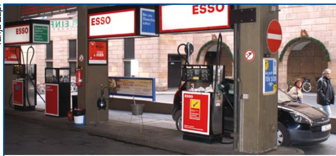
Drei in einem: Uwe Krieger betreibt Parkhaus, Tankstelle und Werkstatt in Nürnberg. Seite 68